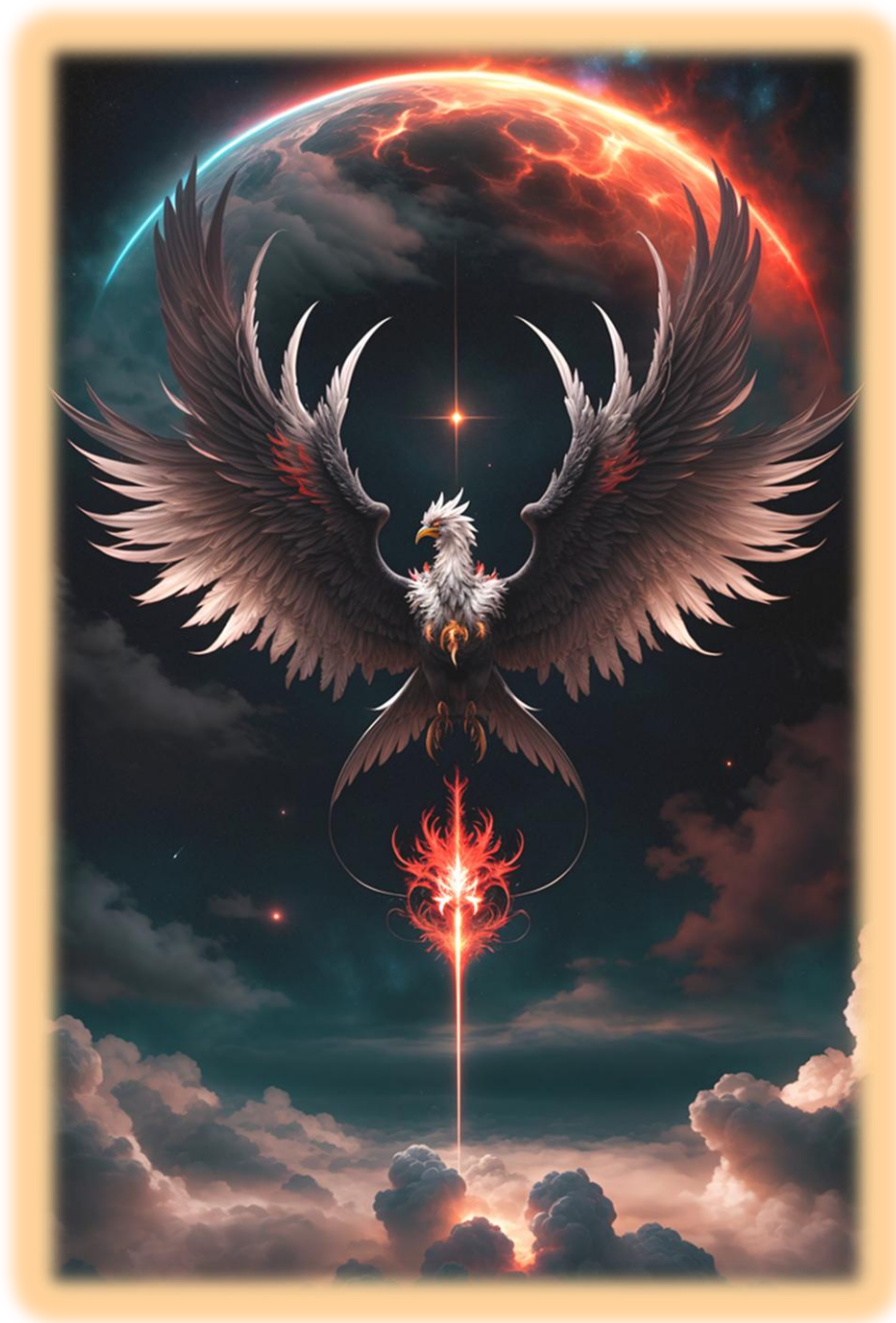
Le phoenix

Je suis le phoenix qui renaît de ses cendres. Je suis là, près de toi !